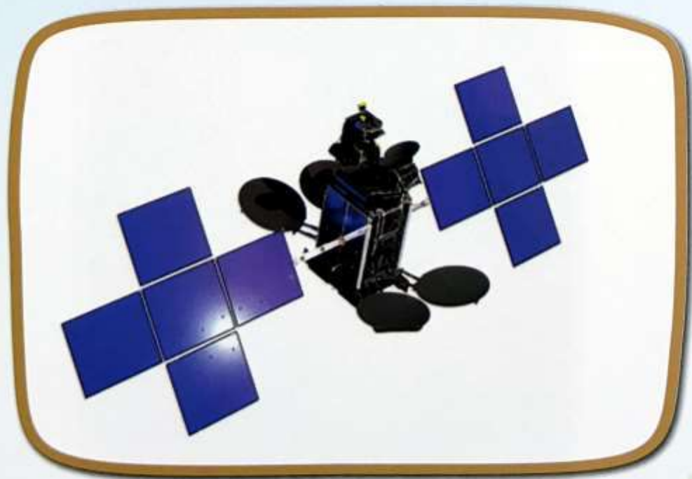
ภาพดาวเทียมไทยคม ๕

พระบาทสมเด็จพระเจ้าอยู่หัว ได้พระราชทานพระบรมราชานุญาต ให้กระทรวงศึกษาธิการถ่ายทอดการเรียนการสอนวิชาต่างๆ จากโรงเรียนวังไกลกังวลไปยังเครื่องรับโทรทัศน์ของโรงเรียนในชนบทที่ขาดแคลนครู และอุปกรณ์การสอน การศึกษาทางไกลผ่านดาวเทียมได้เริ่มดำเนินการมาตั้งแต่ปี ๒๕๓๘ ซึ่งในปัจจุบัน คือ ดาวเทียมไทยคม ๕