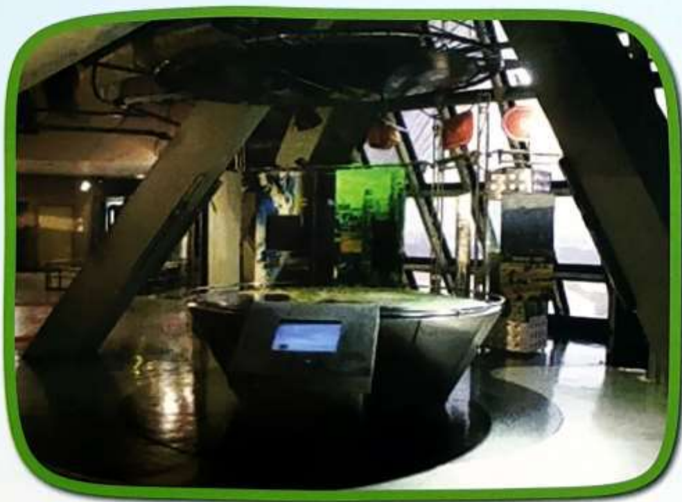
สถานีควบคุมดาวเทียมไทยคมภาคพื้นดิน

พระบาทสมเด็จพระเจ้าอยู่หัว ได้เสด็จพระราชดำเนิน ทรงเป็นประธานในพิธีเปิดสถานีควบคุมดาวเทียมไทยคม ภาคพื้นดินที่ถนนรัตนานิเบศร์ อำเภอเมือง จังหวัดนนทบุรี เมื่อวันที่ ๒๖ มกราคม ๒๕๓๓