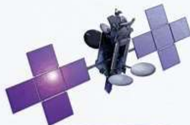
ดาวเทียมไทยคม ๕