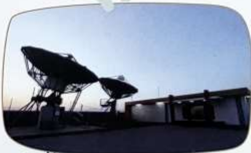
สถานีควบคุมดาวเทียมภาคพื้นดิน