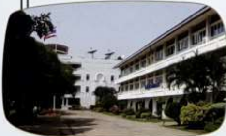
โรงเรียนวังไกลกังวล