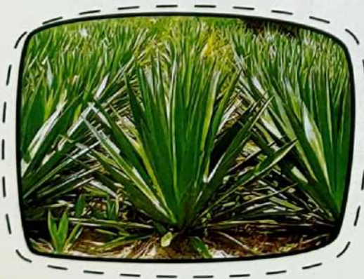
ภาพต้นป่านศรนารายณ์

3. อายุ และการออกดอก ก้านดอกจะเกิดบริเวณตอนกลางของตา ตอนส่วนยอดของต้น จะเกิดเมื่อป่านมีอายุ 7 - 20 ปี หลังจากต้นป่านออกดอกแล้วจะตาย ก้านดอกจะเติบโตเป็นแนวยาวขึ้นตรงไปในอากาศ ประมาณ 4.5 - 7.5 เมตร